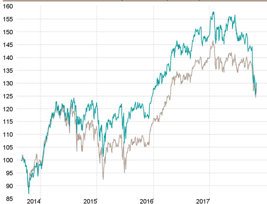
Evolution depuis création (base 100)

— Talence Euromidcap — Indice de référence