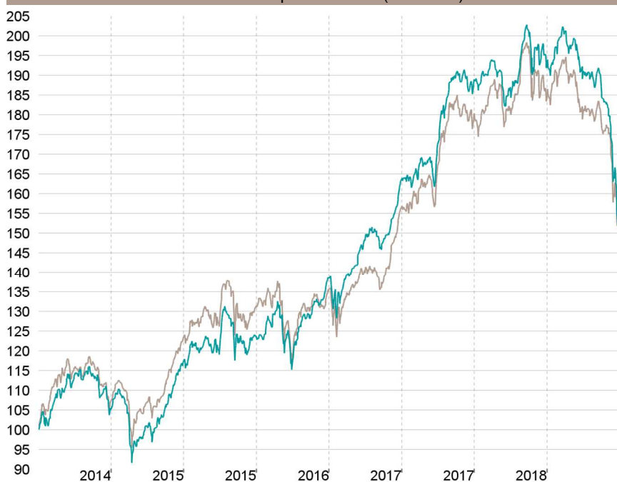
Evolution depuis création (base 100)

— Talence Selection PME — Indice de référence