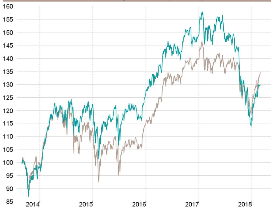
Evolution depuis création (base 100)

— Talence Euromidcap — Indice de référence