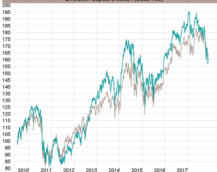
Evolution depuis création (base 100)

— Talence Opportunités — Indice de référence