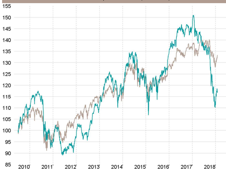
Evolution depuis création (base 100)