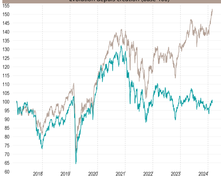
Evolution depuis création (base 100)

— Talence Euromidcap — Indice de référence