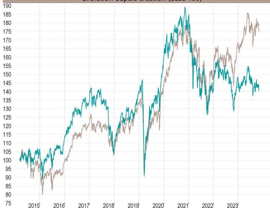
Evolution depuis création (base 100)

— Talence Euromidcap — Indice de référence